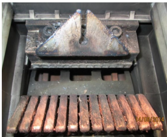
Abb. 1: Ansicht beschädigte Kontaktstellen nach Kurzschluss bzw. nach langer Lebensdauer

Durch die vorbeugende Wartung können sich anbahnende Schäden frühzeitig erkannt und behoben werden, so dass ungeplante Stillstände Ihrer Anlagen verhindert werden. Gleichzeitig werden die gesetzlichen Vorschriften eingehalten und die Anlagensicherheit erhöht.